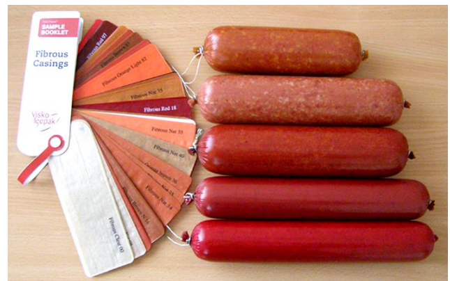
Кольорова гамма фіброувної оболонки «ВіскоТіпак»

№ 1 – колір «Clear 00»; № 2 – колір «NAT 35»; № 3 – колір «B07»; № 4 – колір «Brown 85»; № 5 – колір «Brown 98»; № 6 – колір «Red 97»;