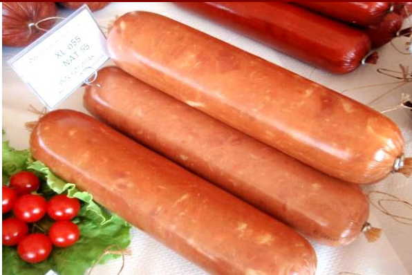
Ковбаса напівкопчена в оболонці Фіброуз XL БРИЛЛІАНТ Ø45 безбарвна