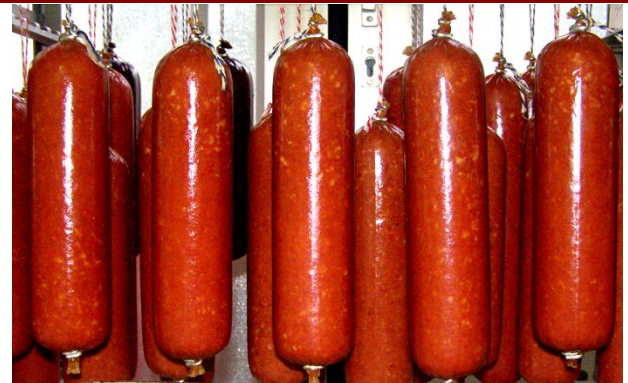
Ковбаса напівкопчена в оболонці Фіброуз XL БРИЛЛІАНТ Ø45 колір «NAT 55»