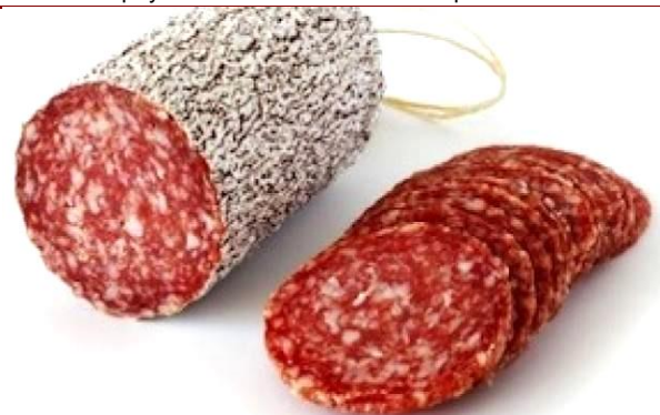
Салями в оболонці Фіброуз ST Ø45 колір White 49 (1+1 Пліснява)»