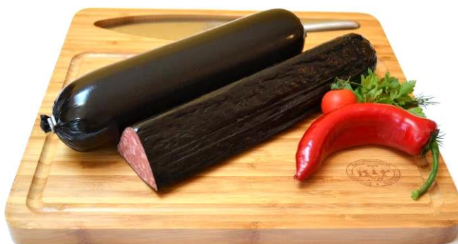
Ковбаса напівкопчена в оболонці Фіброуз XL БРИЛЛІАНТ Ø56 колір Black 41