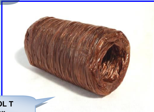
EDICOL T СМОК