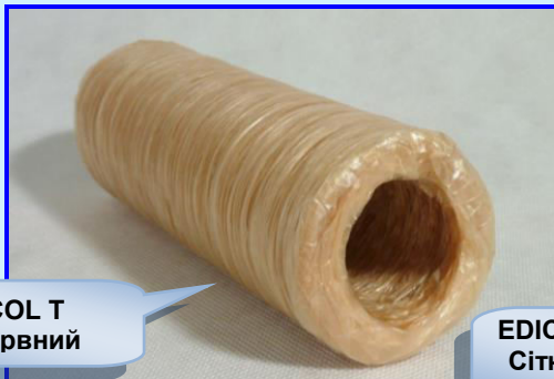
EDICOL T безбарвний