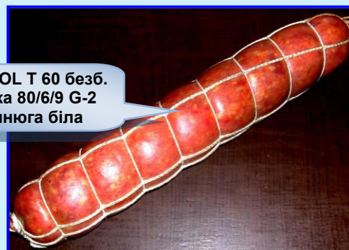
EDICOL T 60 безб. Сітка 80/6/9 G-2 синюга біла