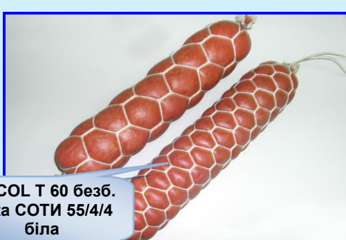
EDICOL T 60 безб. сітка СОТИ 55/4/4 біла