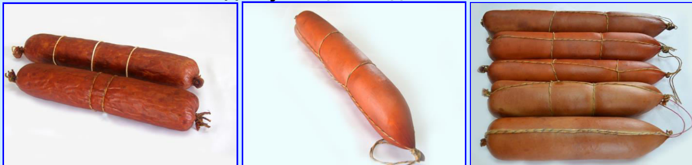
Оболонка «ЕДІКОЛ Т» Ø 60, колір смок

ЗВЕРНІТЬ УВАГУ! Не слід забувати, що «ЕДІКОЛ Т» - тонка оболонка і поводитися з нею потрібно дбайливо! Стандартні рекомендації з використання оболонки «ЕДІКОЛ Т» передбачають її наповнення разом з різними видами сіток . В даному випадку (використовуючи без сітки) потрібно приділяти особливу увагу акуратній роботі з оболонкою в ручному режимі та ретельному налаштуванню обладнання при кліпсуванні оболонки без сітки . Можливість використання кольору смок дозволяє зменшити час термообробки та уникнути зовнішнього фарбування оболонок штучними барвниками.