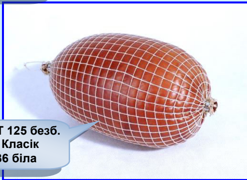
EDICOL T 125 безб. сітка Класік 125/36 біла