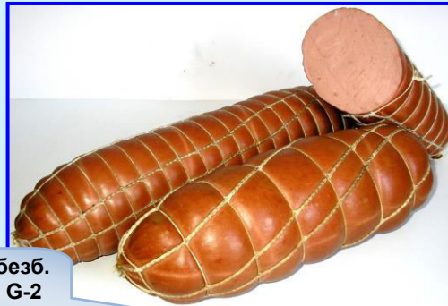
EDICOL T 90 безб. Сітка 100/6/5 G-2 синюга біла