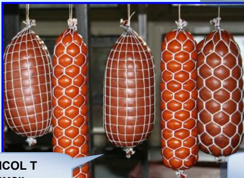
EDICOL T СМОК