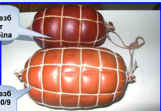
EDICOL T 90 безб Сітка Біг Нет 100/9 синюга біла