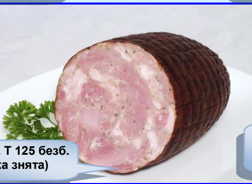
EDICOL T 125 безб. (сітка знята)